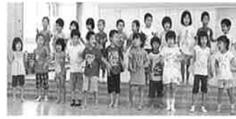
出発！「離れたがらず…泣く子も数名」

女神様から手紙が届き、勇気のうでわの地図が届く。園庭の砂場に埋められていた宝箱を発見！しかし、数日後、海賊によってうでわは奪われる。わんぱく団は伊江島に海賊からの試練を乗り越え勇気のうでわを取り返せるか？！