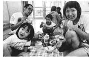
みんなでカレーを食べたよ～