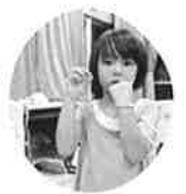
全員とりかえせました(*。~*)就寝