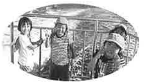
いざ！船に乗船★楽しい～