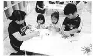
触れ合いコーナー