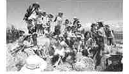
ご飯を食べて、いざ！海賊からの試練に挑戦