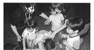
最後の試練！うでわを取り返せ！