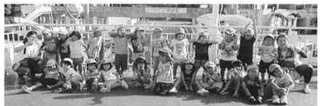
頑張ったお泊り保育も終わり、帰ります。一回り大きくなりました