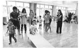
何を作っているのかな？