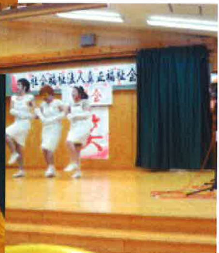
法人新年会 ( H28.1.16 )